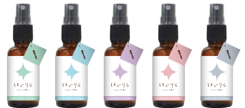
はぐりらのミスト 各30ml

衣類や空間にひと吹きするだけで、その場の空気を変えることができます。 様々なシーンで手軽にお楽しみください。