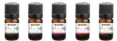
はぐりらのかおり (精油) 各5ml

アロマウッドや アロマディフューザーに精油を 2、3滴垂らし、ゆっくりと広がる 香りをお楽しみください。